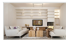
סלון צילום: דודו אזולאי - שני צלמים