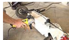
צפו: כך משמידה המדינה אופניים חשמליים לא חוקיים